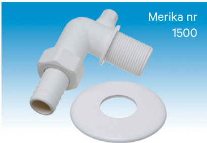
Merika nr 1500