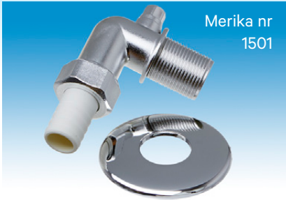
Merika nr 1501